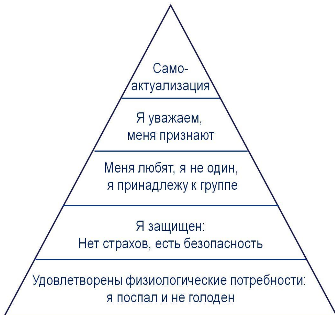
Рис. 1.1. Мотивационная модель А. Маслоу

зрения его духовных и нравственных качеств, заслужить своей деятельностью признание и уважение общества, близких и знакомых людей, стать примером для подражания, оказать содействие другим людям, которые хотят проявить милосердие, но не имеют представления о том, как это сделать. Социальная деятельность – это всегда процесс самосовершенствования.